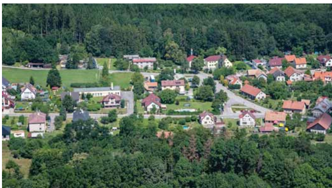
Voděrády - náves