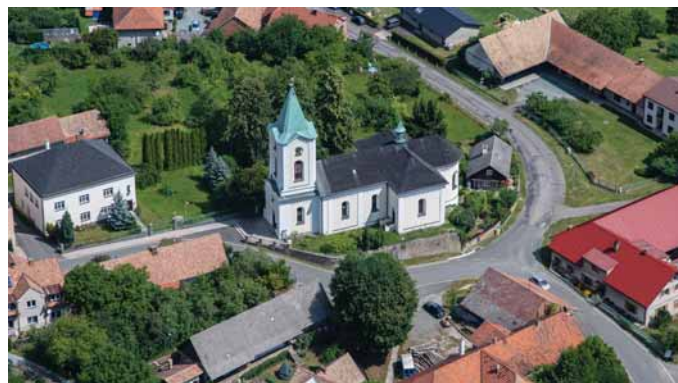
Voděrády - kostel sv. Petra a Pavla